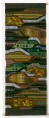
13. Felder im Sommer , 1975, 200/75 cm Ripsbindung 30/10 mit Schlitzten. Kette: Leinen. Schuß: braune Handspinnwolle, farbige Wolle masch. gesponnen, chem. gefärbt.