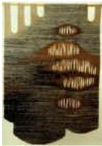
8. Australische Erinnerung I , 1977, 240/160 cm

Ripsbindung 30/10 mit Durchbrüchen. Kette: Baumwollcord. Schuß: feine Eindrahtwolle, chem. gefärbt.