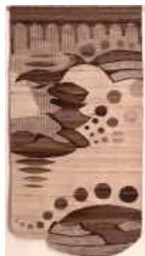
2. Küstenlandschaft , 1975, 230/120 cm Ripsbindung 30/10. - Kette: Baumwolle. Schuß: Wolle, handgesponnen, naturfarben.