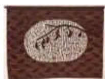
5. Abendstimmung im Fjord , 1978, 130/80 cm Ripsbindung 30/10 mit Schlitzten. Kette: Baumwollcord. Schuß: feine Eindrahtwolle, chem. gefärbt.