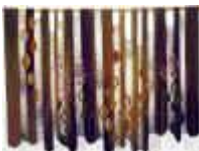
20. Herbstwald , 1975/76, 200/280 cm Ripsbindung 30/10 mit Durchbrüchen. Kette: Baumwollcord. Schuß: Handspinnwolle, pflanzengefärbt.

Copyright und Werksadresse: Kircher Webgeräte Industriegebiet Schneiderstriesch D-35759 Driedorf ( Germany ) Tel. ( +49 ) 02775/953897 Fax 953898 www.Holzkircher.de eMail: info@holzkircher.de