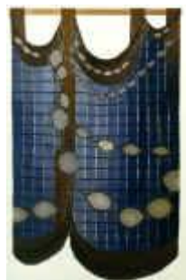
4. Schattenspiel , 1975, 90/120 cm Ripsbindung 30/10 mit Schlitzten. Kette: Baumwollcord. Schuß: Wolle und Seide, beides handgesponnen und naturfarben.