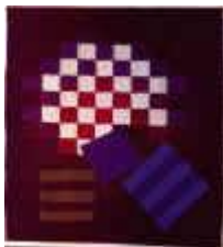
11. Karos in Variationen , 1977, 110/100 cm

Ripsbindung 30/10 mit Schlitzten. Kette: Baumwollcord. Schuß: Handspinnwolle, mit Pflanzen gefärbt.