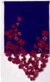
17. Rote Blumen , 1975, 180/100 cm Ripsbindung 30/10 mit Durchbrüchen. Kette: Baumwollcord. Schuß: Wolle, masch. gesponnen, chem. gefärbt.