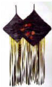
16. Braune Romben , 1975, 180/115 cm Ripsbindung 30/10 mit Schlitzten und Smyrna. Kette: Baumwollcord. Schuß: braune Handspinnwolle farbige Wolle masch. gesponnen und chem. gefärbt.