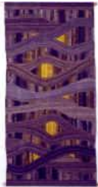
18. Struktur I , 1974/75, 250/120 cm Ripsbindung 30/10 mit Schlitten. Kette: Baumwollcord. Schuß: Handspinnwolle, braun naturfarben, gelb mit Pflanzen gefärbt.