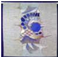
12. Felspalte , 1981, 100/100

Ripsbindung 30/10 mit Schlitzten. Kette: Baumwollcord. Schuß: Grund: braune Handspinnwolle, Karos: farbige Wolle, masch. gesponnen, chem. gefärbt