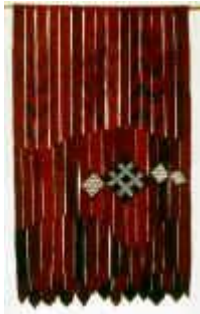
15. Roter Teppich , 1976, 180/100 cm Ripsbindung 30/10 mit Schlitzten. Kette: Baumwollcord. Schuß: Handspinnwolle, mit Krapp gefärbt und eingewebten afrikanischen Perlen.