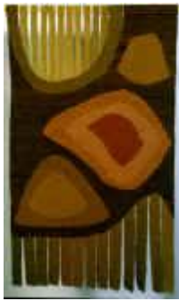
14. Studie in Braun , 1979, 140/80 cm Ripsbindung 20/10 mit Schlitzten. Kette: Baumwollcord. Schuß: Effektwolle, masch. gesponnen, mit Pflanzen gefärbt.