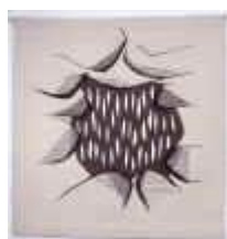
3. Durchblicke , 1980, 120/120 cm Ripsbindung 30/10 mit Durchbrüchen. Kette: Baumwollcord. Schuß: Dochtwolle, masch. gesponnen, weiß naturfarben, grau mit Pflanzenfarben gefärbt.