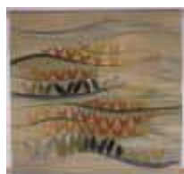
1. Tulpenfeld , 1980, 100/100 cm Ripsbindung, 30/10. - Kette: Baumwollcord. Schuß: Wolle, masch. gesponnen, chemische Farben.