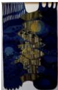
10. Sommertraum , 1976, 330/200 cm

Ripsbindung 30/10 mit Schlitzten. Kette: Hanf. Schuß: Handspinnwolle, mit Pflanzen gefärbt.