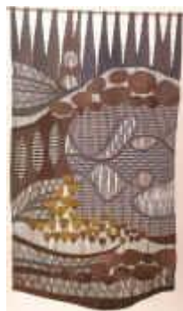
6. Am Weiher , 1976, 170/100 cm Durchbrochene Ripsbindung, 30/10. Kette: Baumwollcord. Schuß: Eindrahtwolle, chem. gefärbt.