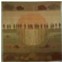
9. Silhouetten , 1978, 170/160 cm

Ripsbindung 30/10 mit Durchbrüchen. Kette: Hanf. Schuß: Rohwolle naturfarben und Handspinnwolle mit Pflanzen gefärbt.