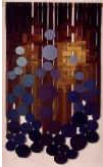
7. Blaue Kreise , 1976, 180/100 cm

Ripsbindung 30/10 mit Durchbrüchen. Kette: Baumwollcord. Schuß: feine Eindrahtwolle, chem. gefärbt.